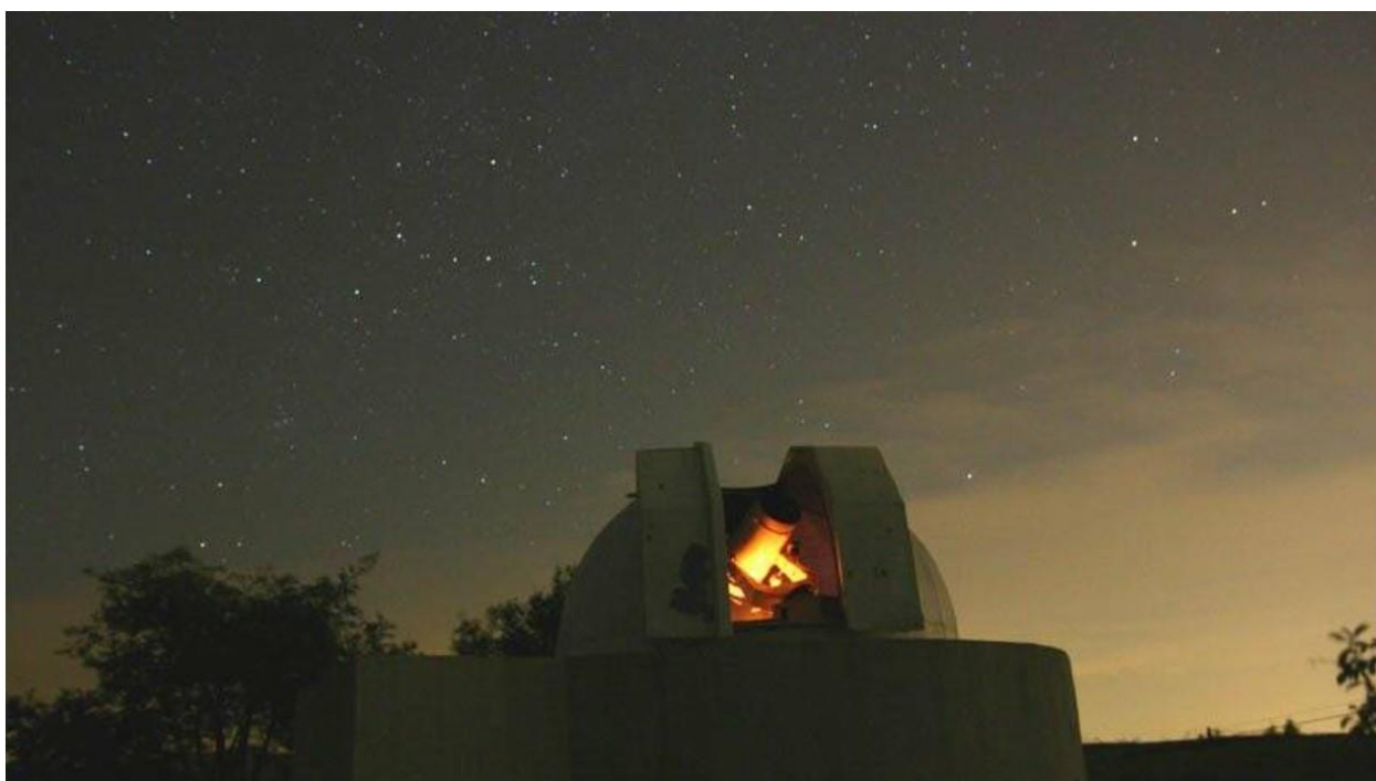
E' l'Osservatorio di monte Viseggi, sulle alture della città della Spezia.

Ma questo è successo quasi un decennio dopo, tanto ci è costato realizzare quel sogno.